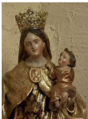
Vierge du carmel de Cadix du XVII e siècle, église Saint-Pierre de Beynat